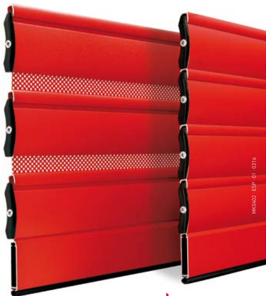
▶ PM-49 microperforada en RAL 3020 texturado